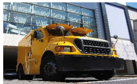
Vehículo Escolta Financiero